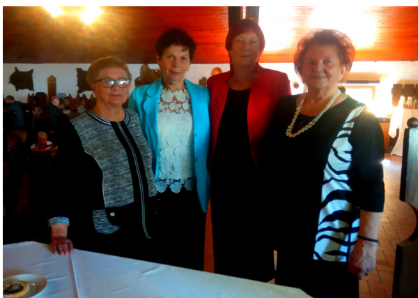
A tyto dámy z regionu Litoměřice se staraly o hladký průběh a také stihly vybrat 2750 Kč na tiskový fond.